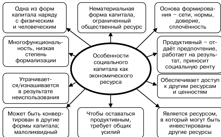
Рисунок 1. Характеристика социального капитала как экономического ресурса

разного использования, поскольку одна и та же сеть социальных связей индивидов может обеспечивать доступ к различным