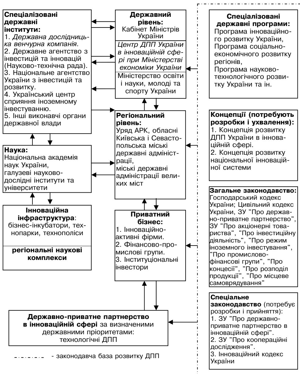
Рисунок 1. Законодавчо-інституційна модель партнерства держави і бізнесу щодо формування інноваційного типу економічного розвитку

жують урядові інвестиції, а космічні проекти цивільного призначення, що можуть потенційно бути прибутковими, мають як урядове, так і приватне інвестування, тоді як суто комерційні проекти отримують інвестиції лише від приватного сектора.