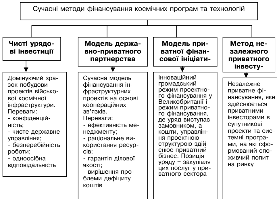
Рисунок 2. Альтернативні методи фінансування цивільних і військових космічних технологій